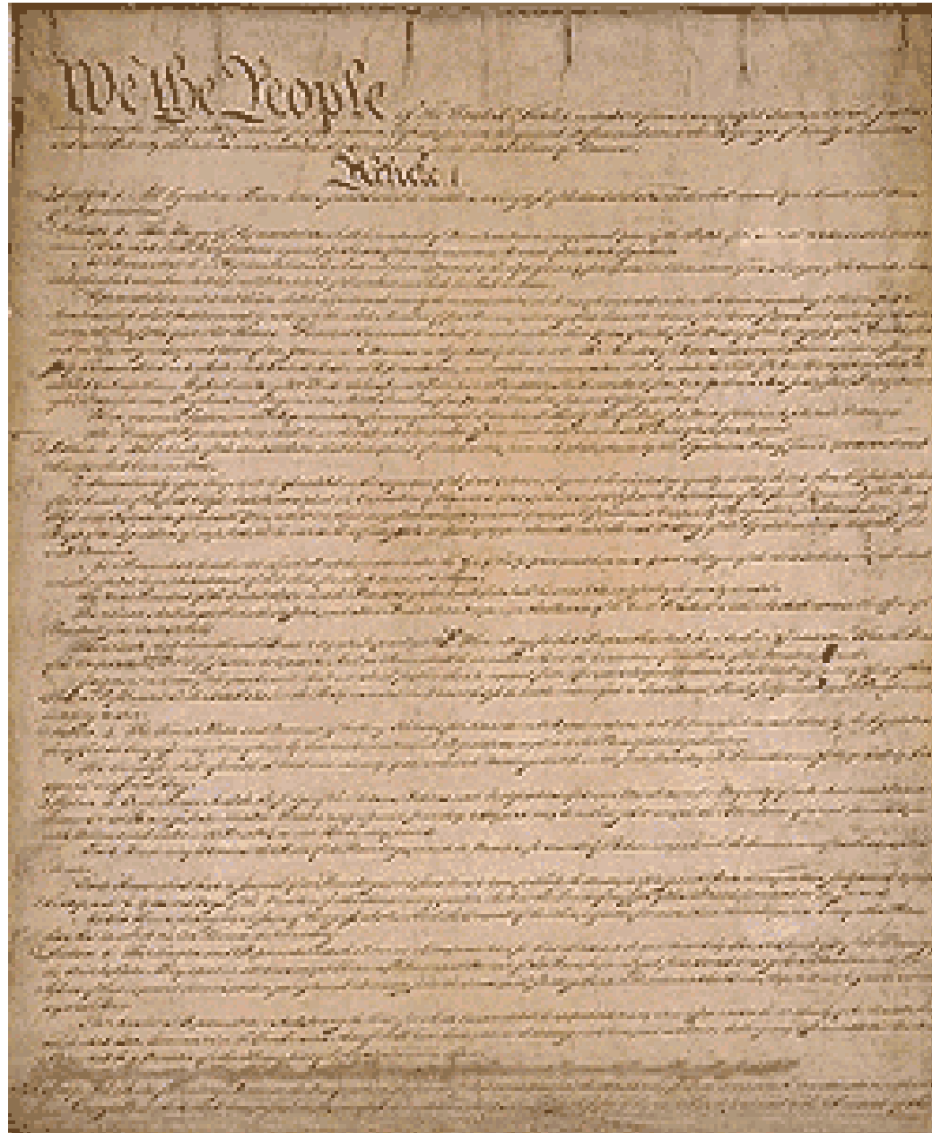
Original U.S. Constitution (1787)